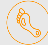
Lámina de fibras sintéticas con resina termo activada, calibre 1.1 mm en el talón y 0.85 mm en la punta , dando firmeza en el calzado sin verse afectado el confort.